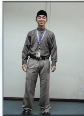
Pakaian semasa sesi perkuliahan pada setiap hari Sabtu dan sewaktu berurusan pada waktu pejabat

Contoh berpakaian yang tidak bersesuaian