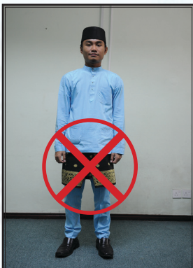
Pakaian yang tidak dibenarkan semasa berurusan pada waktu pejabat

Contoh berpakaian yang tidak bersesuaian