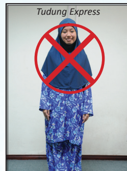
Pakaian yang tidak dibenarkan semasa sesi perkuliahan dan sewaktu berurusan pada waktu pejabat