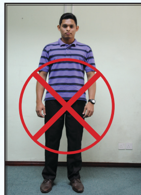
Pakaian yang tidak dibenarkan semasa sesi perkuliahan