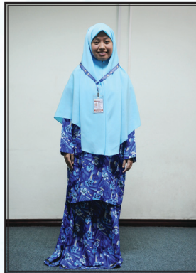
Pakaian semasa sesi perkuliahan dan sewaktu berurusan pada waktu pejabat