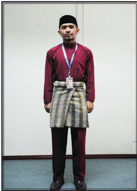
Pakaian semasa sesi perkuliahan